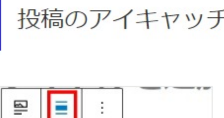
投稿のアイキャッチ画像 画像配置