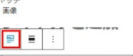
投稿のアイキャッチ画像選択肢

挿入するブロックを間違えた場合は、他のブロックに変更できる。があまり選択肢の幅はない。よく使うブロックに限られる。その為このブロックを削除して改めて選択し直す必要があります。