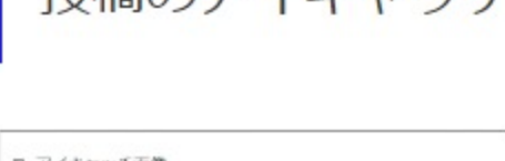
投稿のアイキャッチ画像