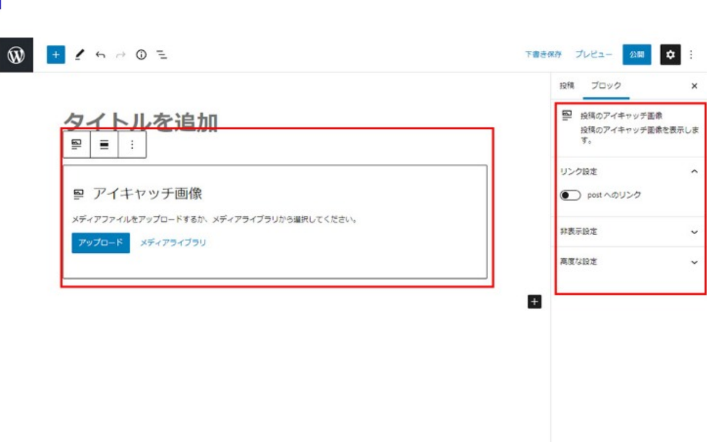
投稿のアイキャッチ画像設定画面

設定方法は右側のサイドバーに表示されます。 ※もし表示されていない場合は画面右上のギアのマークをクリックすると表示されます。